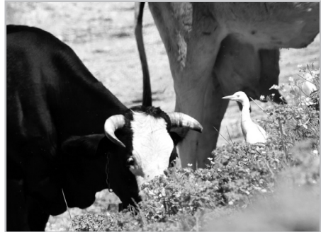
Slika 3. Čaplja govedarica na Hutovom blatu Figure 3. Cattle Egret in Hutovo blato

Uzimajući u obzir da je čaplja govedarica po prvi put na gniježđenju u Srbiji zabilježena 2010. (Ham, 2010) i Hrvatskoj 2015. godine (Vasilik, 2015), postoji mogućnost da se ova vrsta, ako nije već u navedenom trogodišnjem periodu, počne gniježditi na Hutovom blatu.