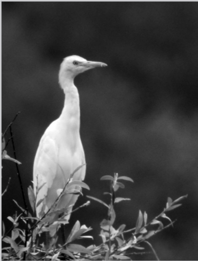
Slika 2. Čaplja govedarica na Hutovom blatu Figure 2. Cattle Egret in Hutovo blato

Uzimajući u obzir da je čaplja govedarica po prvi put na gniježđenju u Srbiji zabilježena 2010. (Ham, 2010) i Hrvatskoj 2015. godine (Vasilik, 2015), postoji mogućnost da se ova vrsta, ako nije već u navedenom trogodišnjem periodu, počne gniježditi na Hutovom blatu.