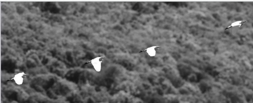
Slika 4. Čaplja govedarica na Hutovom blatu Figure 4. Cattle Egret in Hutovo blato

Na Buškom jezeru čaplja govedarica je zabilježena u periodu od sredine jula do kraja septembra 2016. godine (Tab. 1), s tim što je zabilježena samo jedna jedinka na vlažnim livadama uz nasip Buškog jezera. Na ovom području nije bilo aktivnosti koje bi upućivale na veći broj jedinki na drugom dijelu jezera ili na mogućnost gniježđenja.