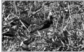
Slike 5.-6. Kameničar u blizini Šamca Figures 5-6 Ruddy Turnstone near Šamac