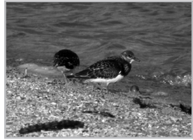
Slike 2.-4. Kameničar na Buškom jezeru Figures 2-4 Ruddy Turnstone in Buško lake