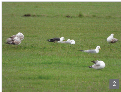
Slike 1-2. Crna prutka ( Tringa erythropus ) i tamnoledi galeb ( Larus fuscus ) na Duvanjskom polju